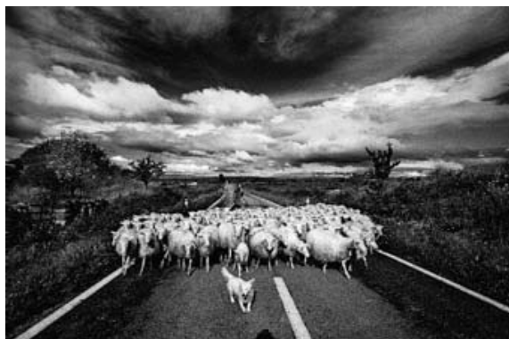
Sedilo